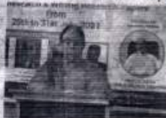
कार्यशाला को संबोधित करती हैं प्रिंसिपल