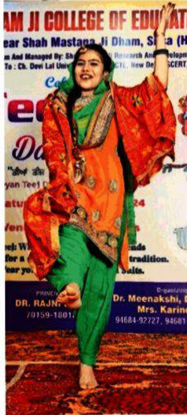
कार्यक्रम में प्रस्तुति देती छात्रा।